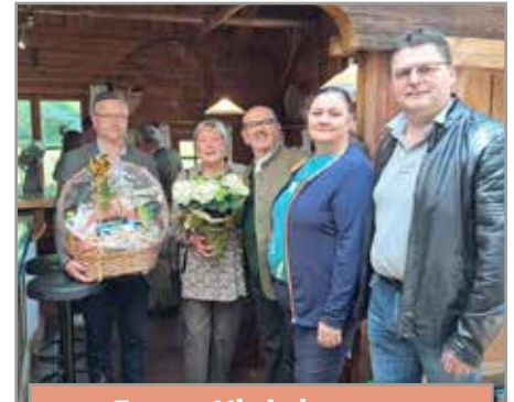
Franz Kleinburger Dorf - 80 Jahre