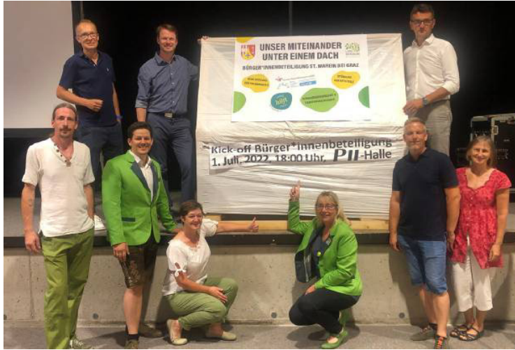
Ein Dach als verbindendes Element aller Ortsteile: „Unser Miteinander unter einem Dach“ lautet das Zukunftsmotto.